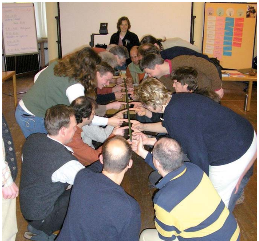
Gruppenspiele fördern die Kommunikation – auch ohne Handy